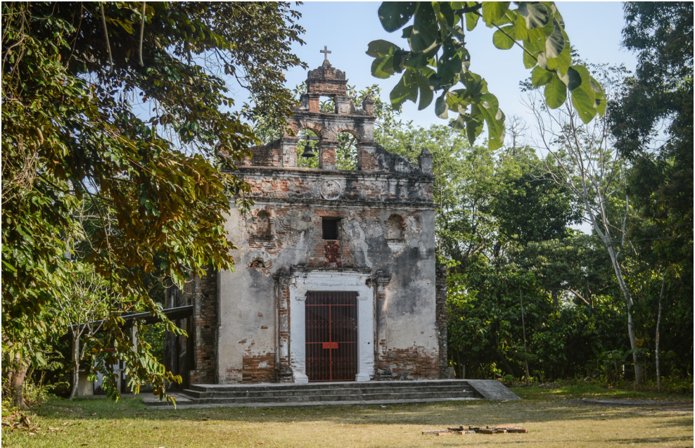
Fotografía 2 - Iglesia Las Mirandillas perspectiva 2

valores compartidos. En el caso de la Iglesia Las Mirandillas, su permanencia implica más que la conservación de un templo religioso: significa preservar el corazón simbólico de la comunidad de La Piedra.