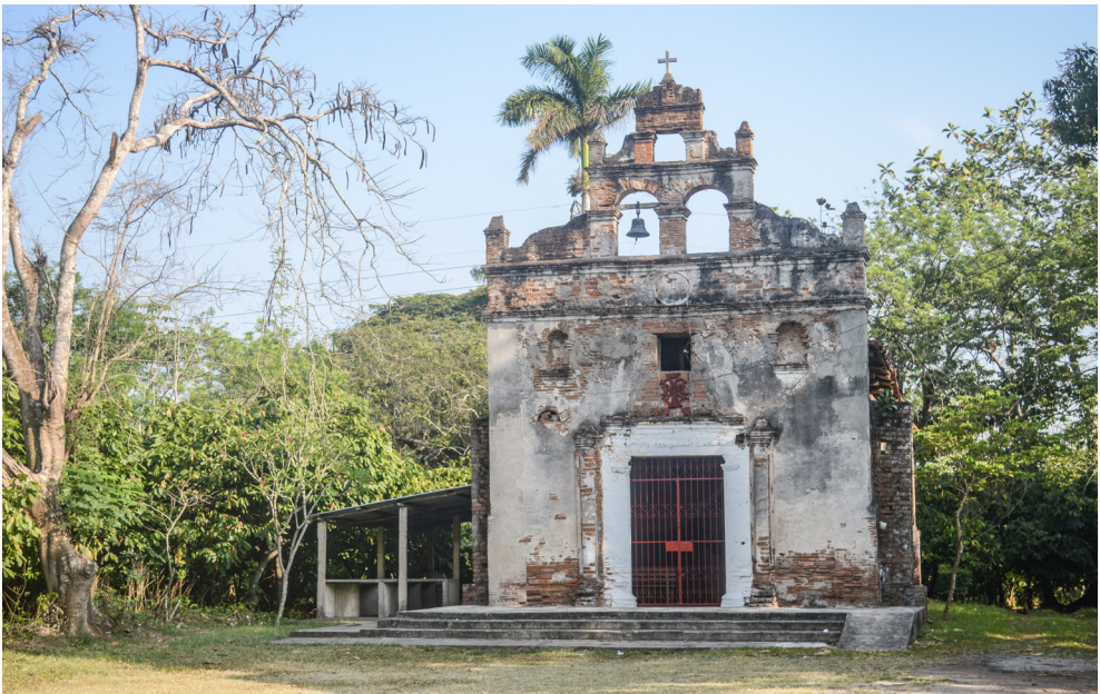
Fotografía 1 - Iglesia Las Mirandillas

Dentro del patrimonio cultural se encuentran las iglesias. En Tabasco existen 106 parroquias pertenecientes a la Diócesis de Tabasco. Una de ellas es la Iglesia Las Mirandillas, edificada en 1724 y considerada la segunda parroquia más antigua del estado de Tabasco. Es un patrimonio cultural significativo. A pesar de su relevancia, existe escasa documentación institucional sobre su historia, lo que da origen a la presente investigación.