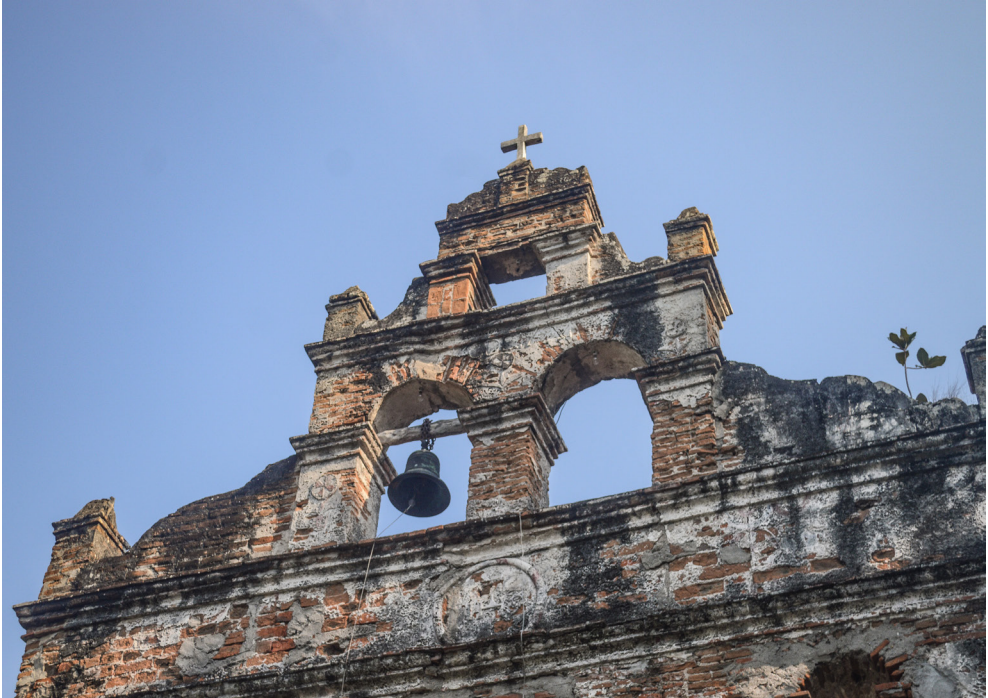
Fotografía 3 - Tipo de construcción.

El tipo de estudio es descriptivo exploratorio ya que identifica y describe las representaciones sociales de los habitantes que viven próximos a la Iglesia Las Mirandillas. Hoyos y Espinoza (2013) mencionan: